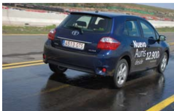
Magnífico el comportamiento en las pruebas de frenado.