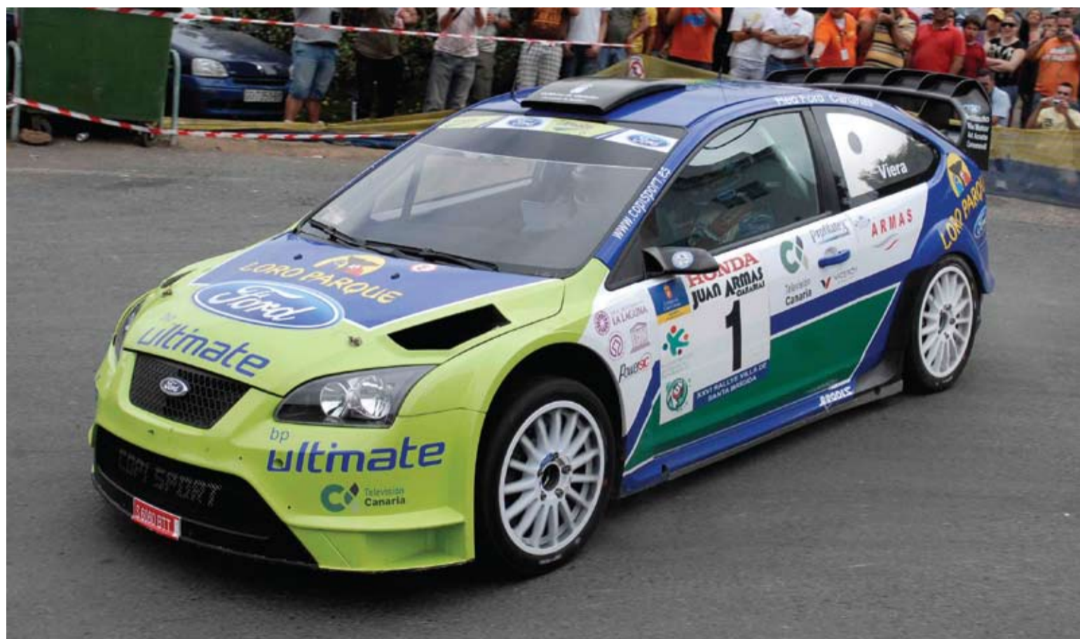
El equipo del Ford Focus WRC, de Copi Sport, empieza la temporada con una victoria.