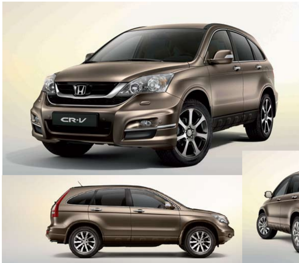
El nuevo Honda CR-V 4x4 de la marca ofrece un aspecto robusto pero al mismo tiempo deportivo y práctico.

La nueva gama Honda 4x4 presenta un sentido dinámico del estilo y el refinamiento a la vez que una deportividad y practicidad.