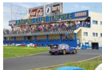
Espectación en la prueba del Porsche.