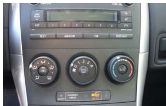
Consola completa de sencillo manejo.

velocidad de 100Km/h en una superficie mojada expresamente, y con una frenada "a romper", el Auris, no pierde la dirección y para de forma eficiente. Igualmente remarcables los elementos de seguridad activa como el ABS, BA y EBD