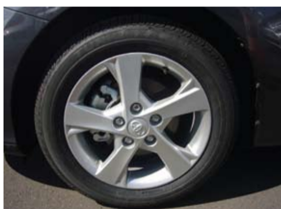
Llantas de nuevo diseño.