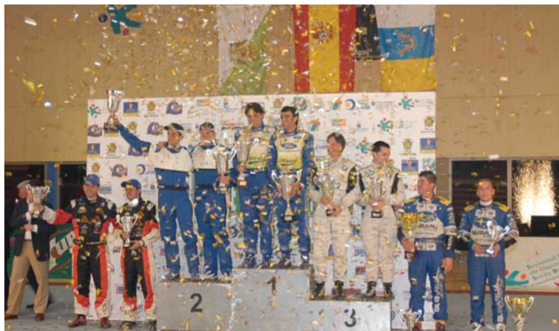
El podio con los cinco primeros equipos clasificados.