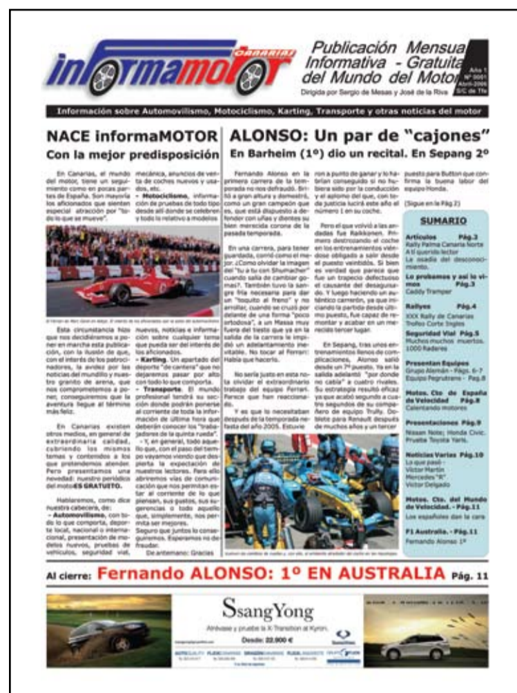
Portada del primer informaMOTOR que nació el 1-04-06. www.informamotor.com