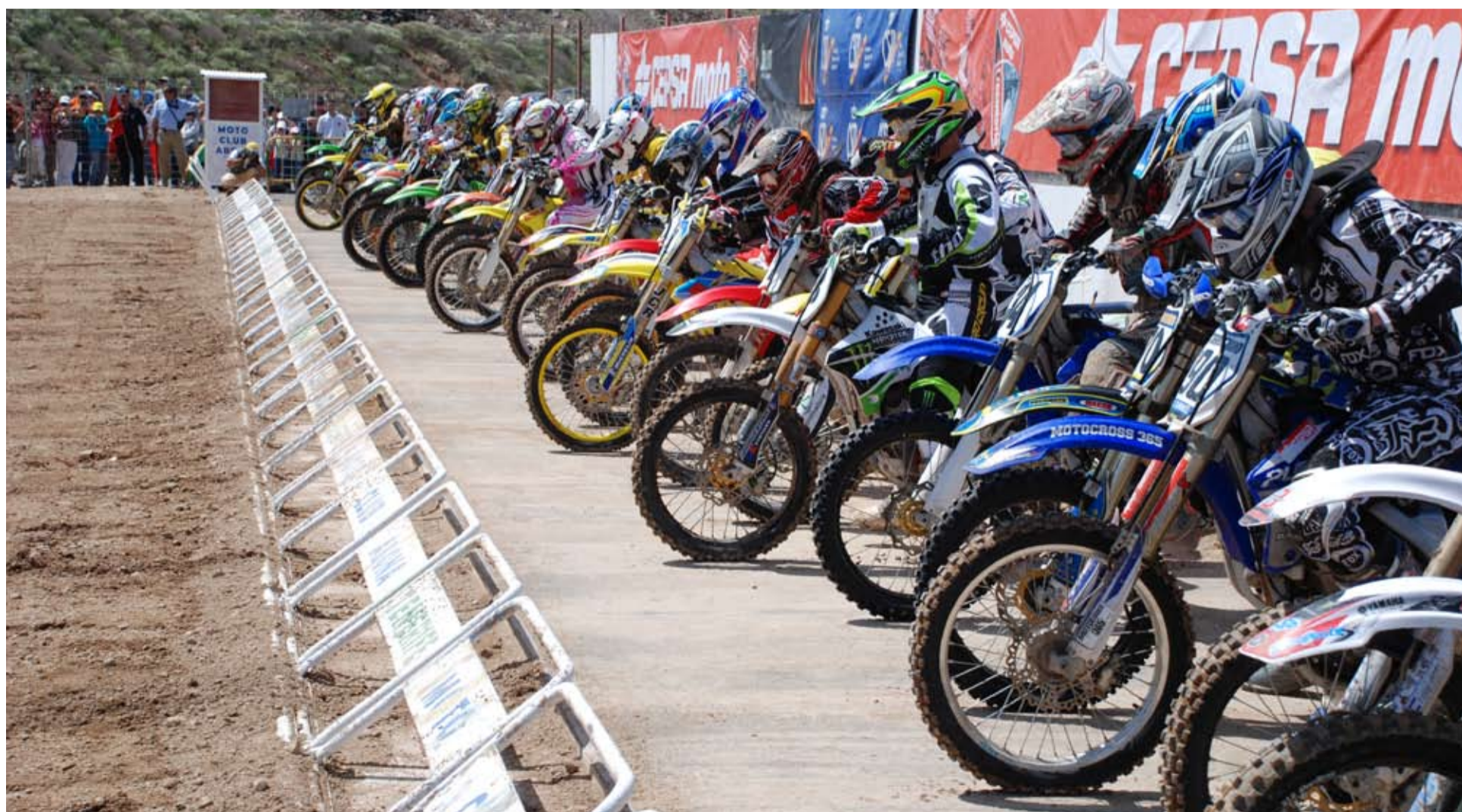
Salida del MX 2009.