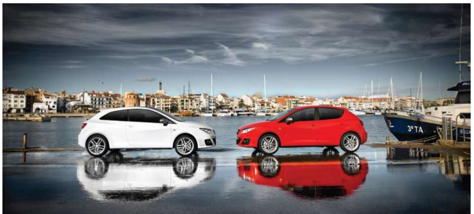
La marca española Seat matriculó 14.988 vehículos en los dos primeros meses del año 2010.