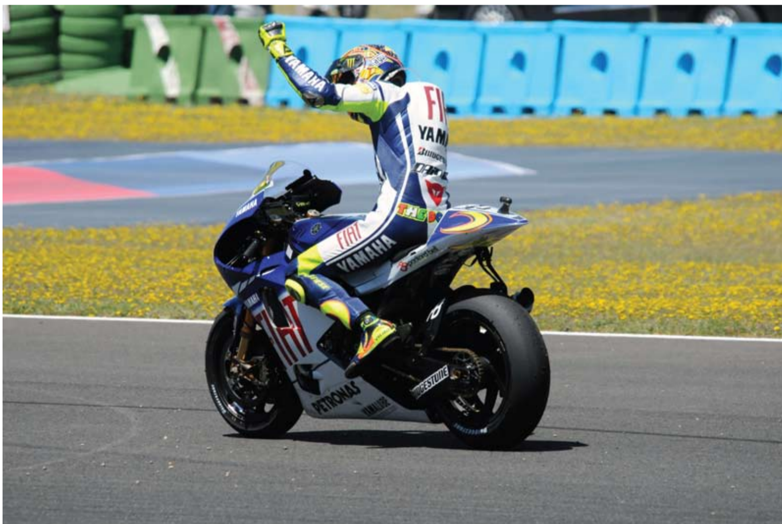
Valentino Rossi tendrá que enfrentarse a duros rivales este año desde la primera carrera