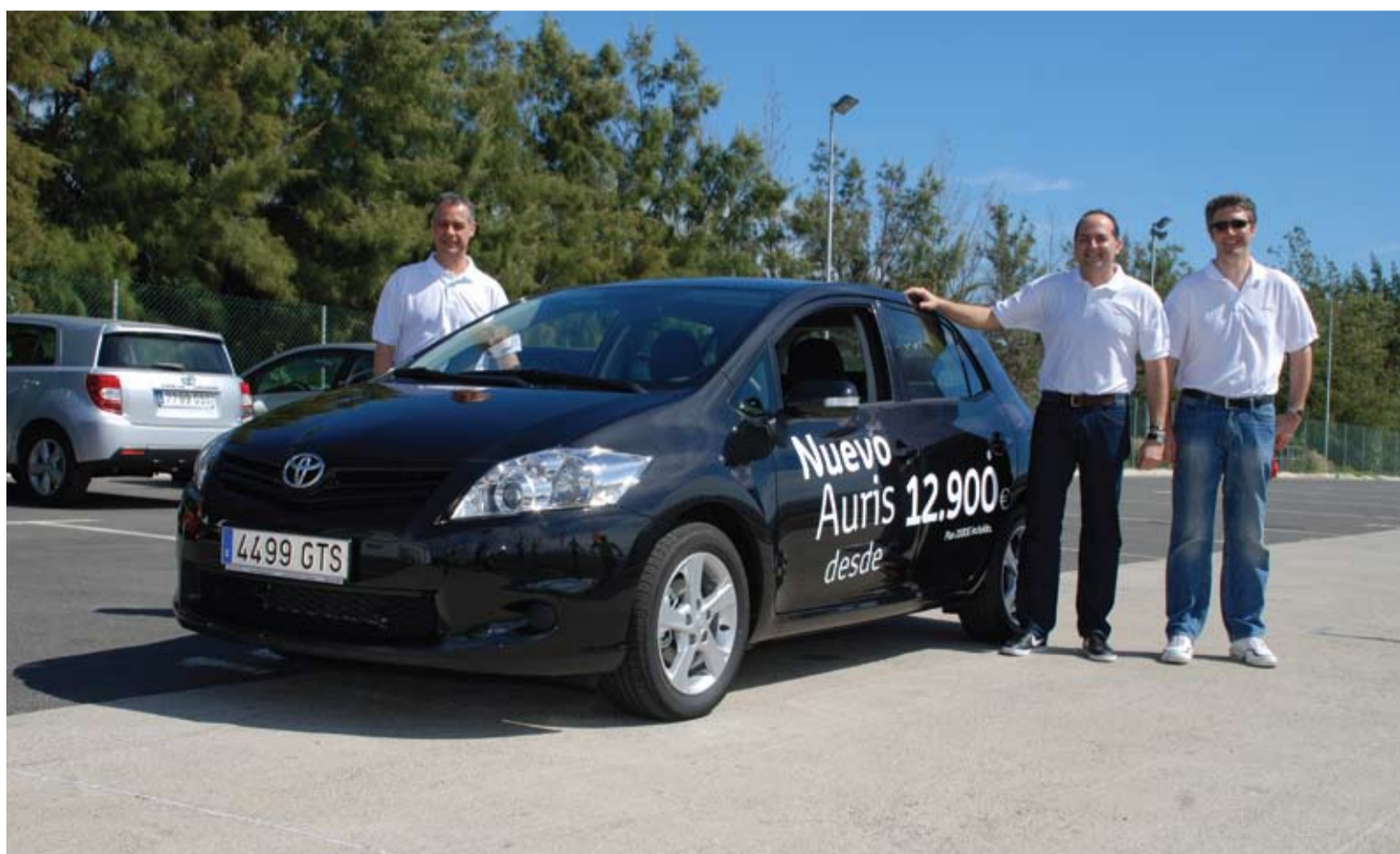
Responsables de la marca en Canarias con el nuevo Auris que ha sido calificado con 5 estrellas Euro NCAP.