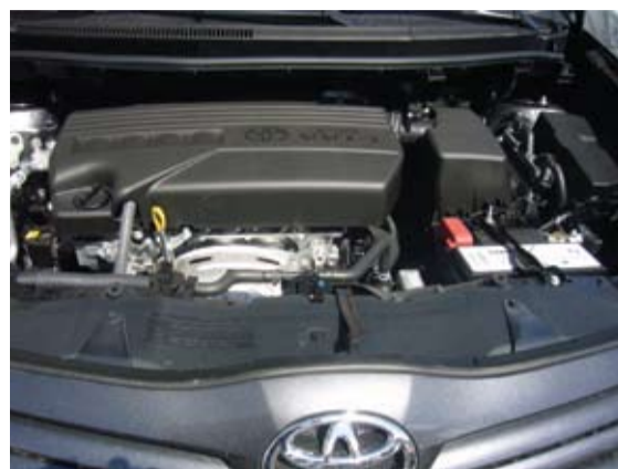
Tres motores donde elegir.