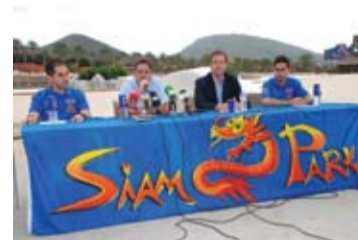
Momento de la presentación.