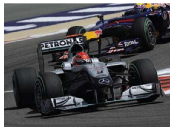
Schumacher discreto en su retorno. Necesitará tiempo.