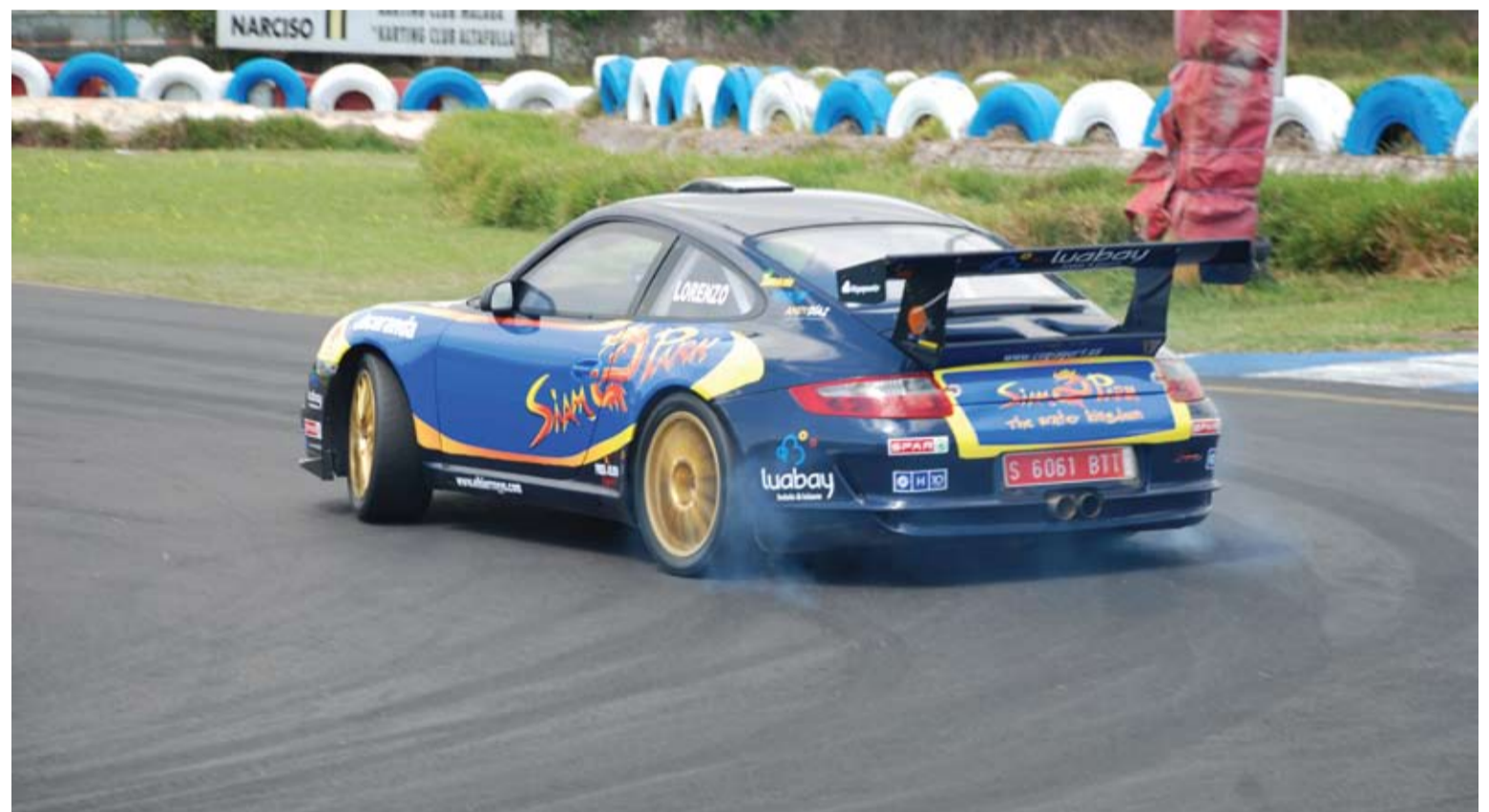
Marco Lorenzo tendrá el principal objetivo de rodar y rodar para irse aclimatando a las peculiares características del Porsche 911 GT3.