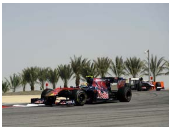
Alguersuari sigue progresando. Acabó 13°.

Texto: José de la Riva