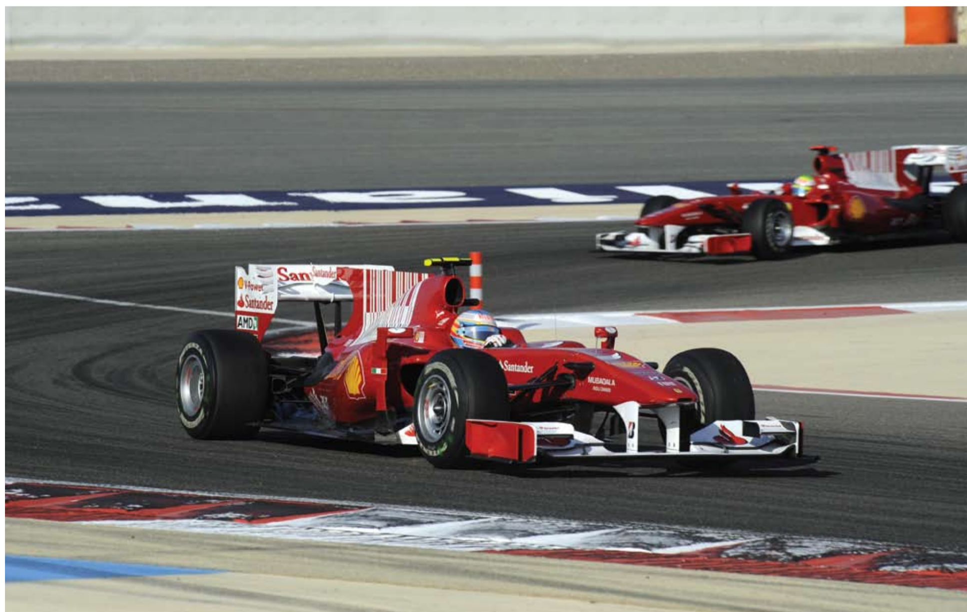
Día histórico para el español Fernando Alonso, para Felipe Massa y para Ferrari que consiguieron, después de mucho tiempo, un doblete para la marca italiana.

La clasificación de la primera carrera es, al mismo tiempo, la provisional de 2010.