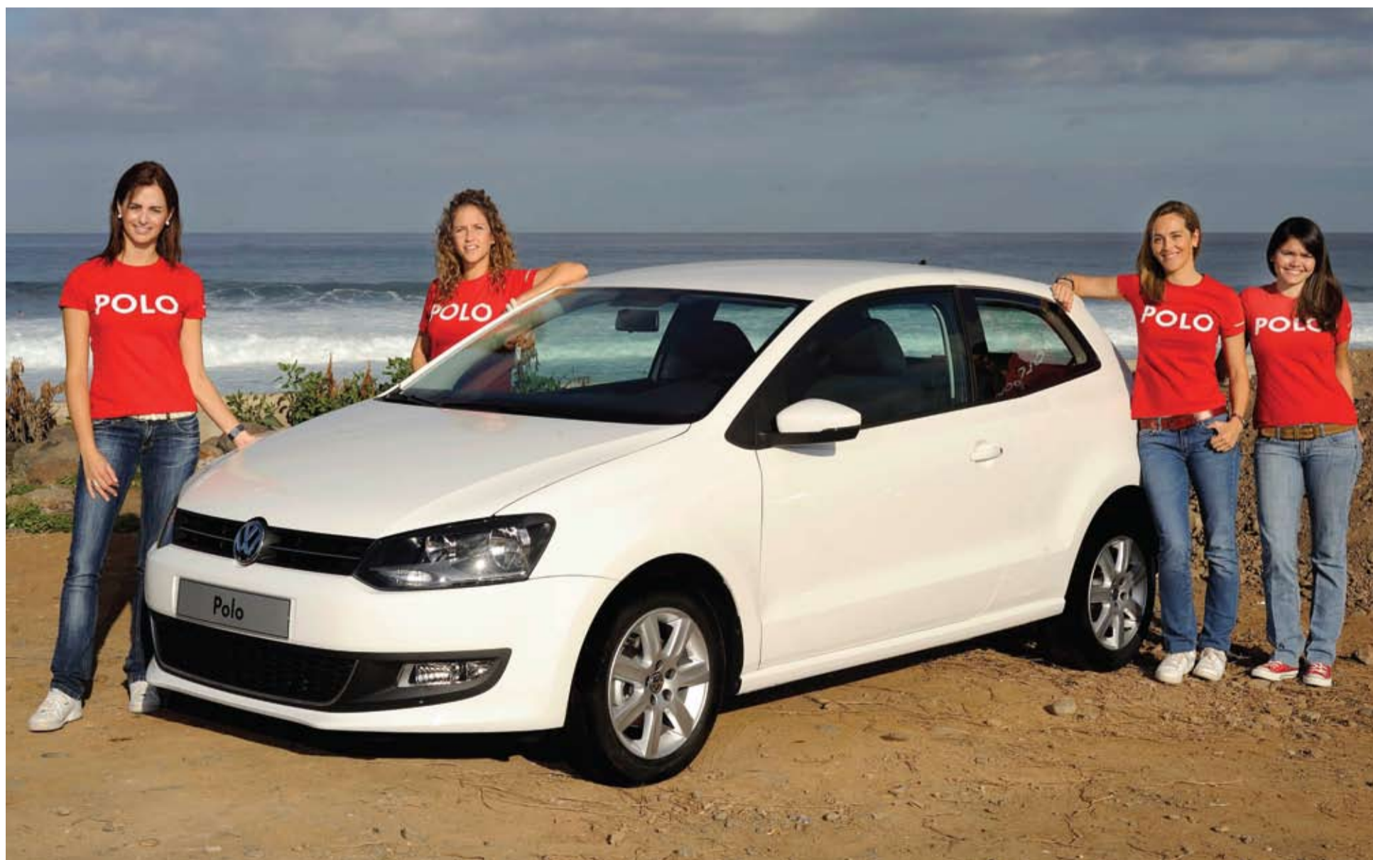
El nuevo modelo presenta un diseño más elegante, ágil y con cierto estilo coupé.