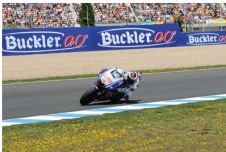
Jorge Lorenzo arranca el Mundial con el objetivo de ganar el título.