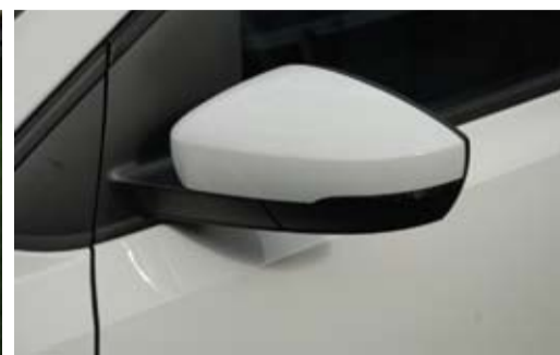
Algunos detalles de la quinta generación del modelo, elegido en Europa Coche del año 2010 y el más vendido en Canarias en 2009.