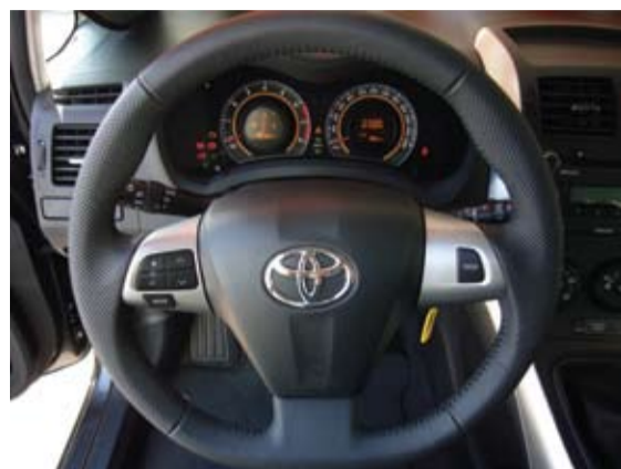
Volante, de cuero, ajustable en altura y profundidad.

Pudimos probar el comportamiento del coche en condiciones complicadas. A una