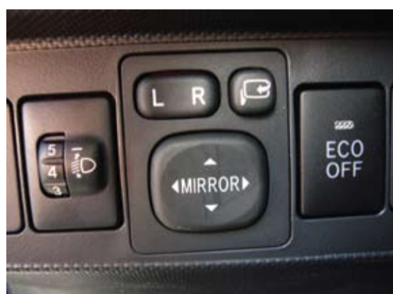
El stop&start es fácilmente desconectable (Eco off).